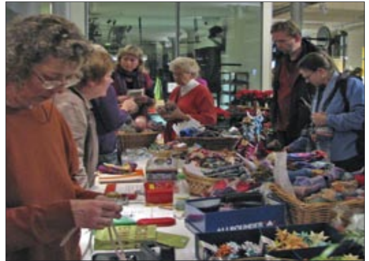
Verkaufstisch unserer „Sternengruppe“

Dann stehe ich beim Postkartenmaler, der bizarre Figuren malt oder probiere die vielen Stulpen, die wir früher Pulswärmer nannten, jetzt aber fast zu schade zum Druntertragen sind. Und Honig und Leder und Wachskerzen, Horn, Holz, Silberschnallen und Schmuck, und alles wird einem freundlich erklärt und die Kerzen kann man auch selber machen und ich bin schon ganz durcheinander von den vielen Eindrücken und Ge-