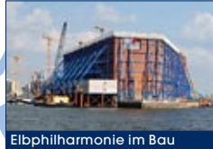
Elbphilharmonie im Bau