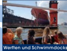
Werften und Schwimmdocks