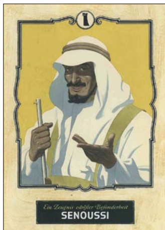
Anzeigenentwurf, Hans Domizlaff Reinzeichnung auf Karton, 1954