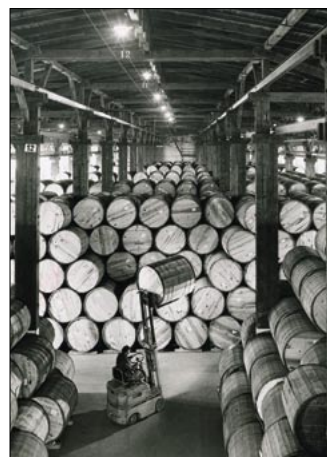
Tabakfässer im Spreicher C am Melniker Ufer, Foto Hans Cordes 1955