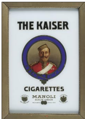
Werbeanzeige für Manoli No. 8 „The Kaiser“, 1914