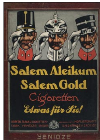
Werbeanzeige für Salem Gold, um 1914