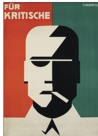
Plakat der Bulgaria Zigarettenfabrik Grafik Ilse Lagerfeld, um 1928