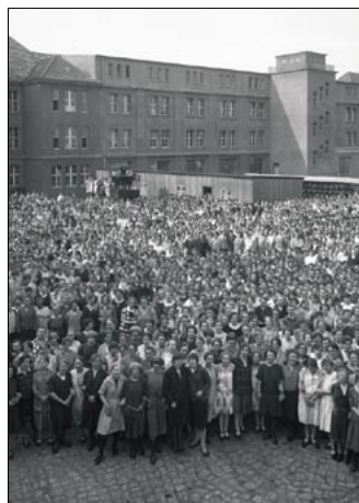
Die Reemtsma-Belegschaft vor dem Werk Bahrenfeld, um 1925 (Ausschnitt)