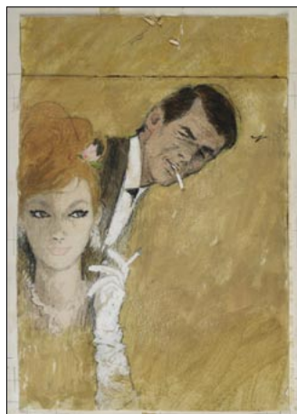
Werbemotiv für die Marke Astor, Max Hoff, Kreide auf Karton, 1964