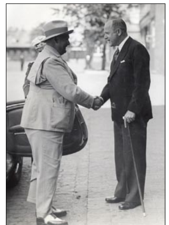
Hermann Göring besucht Philipp Reemtsma, 29.6.1936 (Ausschnitt)