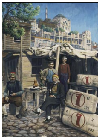
Lastträger in Konstantinopel Kolorierte Fotografie, 1924/25