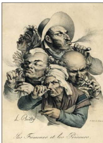
„Les Fumeurs et les Priseurs“ Louis-Léopold Boilly, Lithografie, 1925