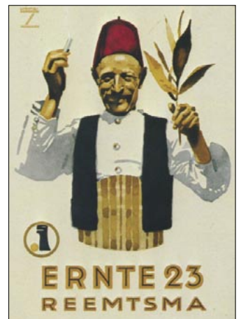
Werbung für Ernte 23 Farblithografie, Ludwig Hohlwein 1925